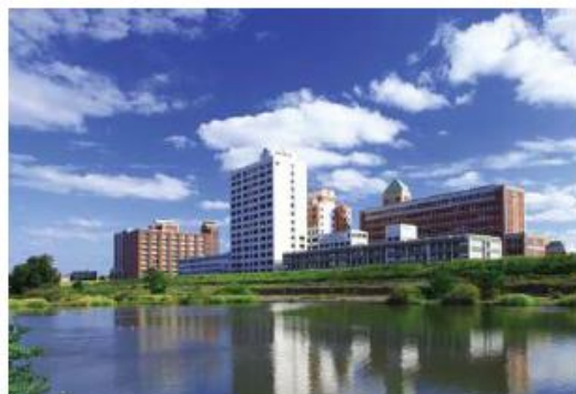
淀川から見た大宮キャンパス

〒535-8585 大阪市旭区大宮5丁目16-1 TEL.06-6954-4435 (事務室)