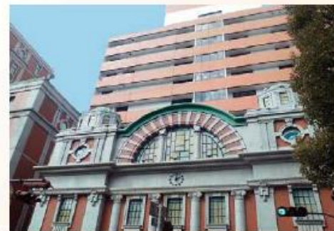
片岡 安メモリアルゲート(大阪工業大学正門)

向学心あふれる学生を最初に迎える赤煉瓦造りの「片岡 安メモリアルゲート」は、学園創設時の著名な建築家で、初代校長・理事長の片岡 安 博士が実施設計した「大阪中央公会堂」をモチーフにしており、大阪工業大学の英知とパイオニア精神を象徴しています。